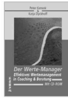
> DER WERTE-MANAGER