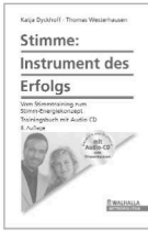
> STIMME: INSTRUMENT DES ERFOLGS

Dyckhoff/Westerhausen Heidebergenstraße 21 · D-53229 Bonn Fon: 0049 (0) 228.9 48 04 99 Mobil: 0049 (0) 171.3 65 55 10 E-mail: info@power-research-seminare.com www.power-research-seminare.com